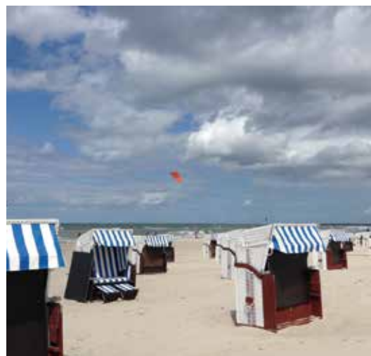
... da Claudia Cathomen da Warnemünde (D).