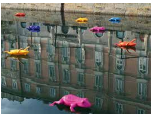
... da Gian Ramming dal Canale Grande a Triest (I).