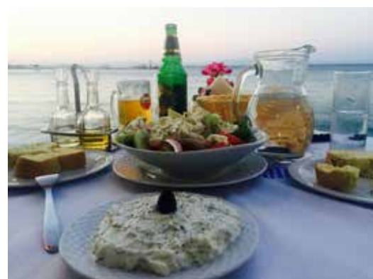
... dad Oceana Galmarini da Kos (GR).