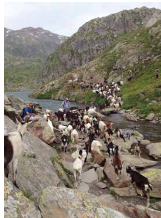
... da Corina Luck dal Lai da Tuma.